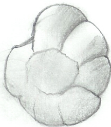
Face involute (ombilicale)